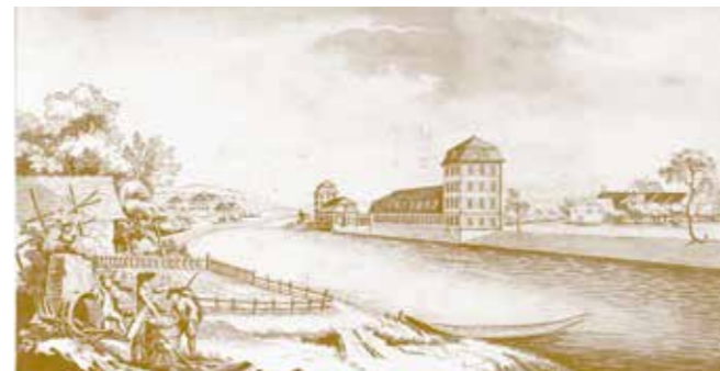
Flusslandschaften prägten bereits in der Gründerzeit die Architektur.

In der Überbauung Sihlbogen entstehen direkt am Ufer der Sihl 140 (Areal B) moderne Mietwohnungen mit 3½ beziehungsweise 4½ Zimmern sowie Wohnateliers. Geplant sind flexible Grundrisse mit unterschiedlichen Grössen, die Raum für moderne Lebensformen bieten. Zu S-Bahn und Strasse hin schaffen die grosszügigen Loggien die nötige Distanz und sind zugleich sonniger, privater Aussenraum. Auf der Flussseite sorgen geschosshohe Fenster für viel Licht und einen ungehinderten Blick aufs Wasser und ins Grüne. Die zwei markanten, langgezogenen Wohngebäude lehnen sich formal an die Fabrikbauten des Industriezeitalters an, die das Sihltal seit rund 200 Jahren prägen. Für die künftigen Bewohnerinnen und Bewohner des Sihlbogens bietet die Konzentration des Bauvolumens auf total drei Baukörper weitläufige, offene Aussenräume.