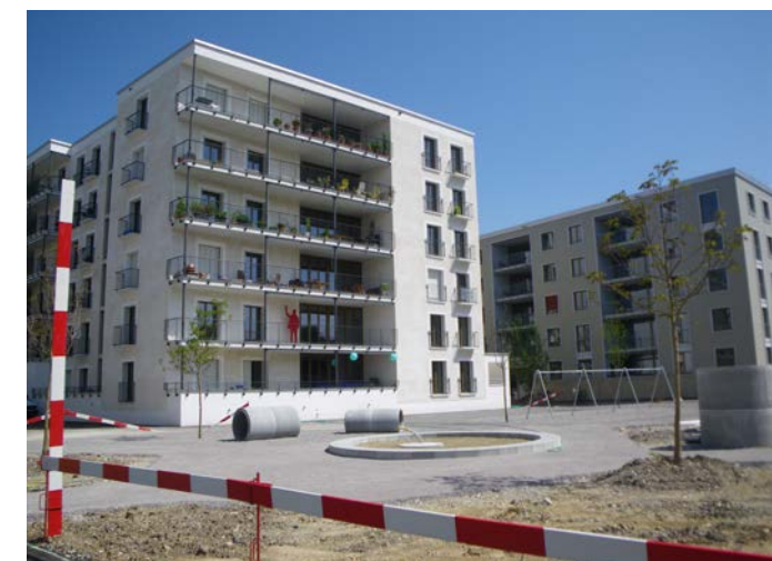
Mit Besichtigung Projekt mehr als wohnen (Erstbezug)

Mittwoch, 7. Oktober, 13.30 – 16.45 Uhr Ort: Baugenossenschaft mehr als wohnen, Hagenholzstrasse 104, Zürich